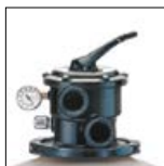
Areia facilmente acessível graças ao colar de desmontagem