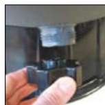
Purgador com tampão de grande dimensão que serve de ferramenta de desmontagem