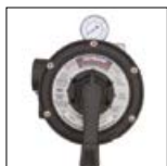
Válvula Vari-Flo™ de 6 posições